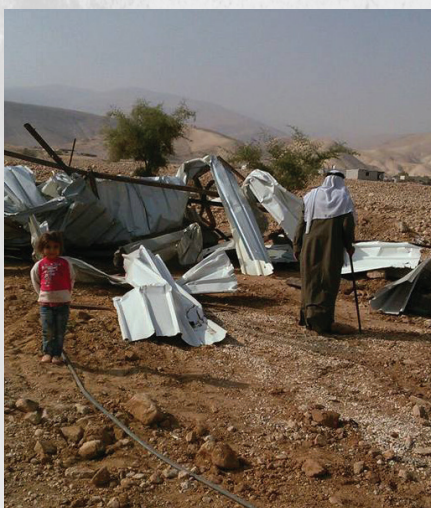
לקריאה נוספת ראו דו"ח בצלם: http://bit.ly/2me8S7n